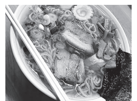
2021年度 郷土の魅力発信委員会 委員長 佐久間 陽

村上市・岩船郡地域にある、自然、街並み、温泉、グルメ等様々な魅力をより強力で発信していくため、2月～10月にかけてInstagramで魅力発信を行いました。Instagramに馴染みのないメンバーも多かったため、1月には外部の方も交えて教室を実施して準備を行ない、2～10月で事業に関係する投稿は1500件超にもなりました。当地域の魅力を今後も継続して発信していければと思います。