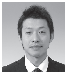
委員 三科 孝幸 ㈱フォト・スタンプ新潟