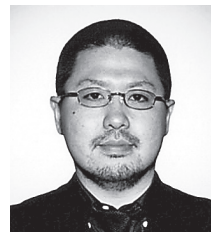
事務局 富樫 正樹 ㈱メディア