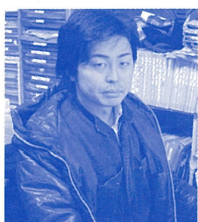
事務局 山ノ井道夫 ㈱ヤマノイ